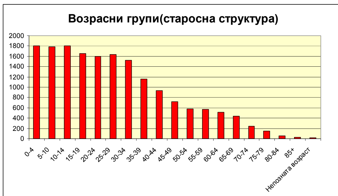
Табела бр. 2 – Возрасни групи (старосна структура) во општина Студеничани

Извор: Попис на населението, домаќинствата и становите во Република Македонија, 2002 книга XIII) Државен завод за статистика