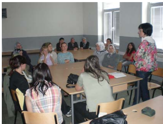
- Дел од работилниците со жените Албанки во општините Студеничани и Теарце -