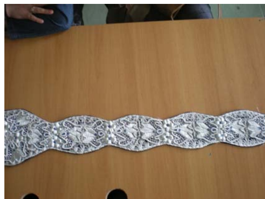
- Димии, кафтан и појас за димии -